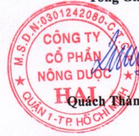
Quách Thành Đồng