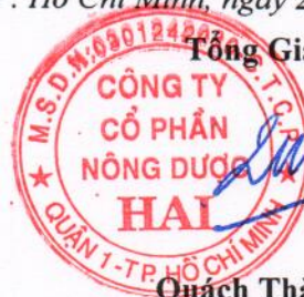
Quách Thành Đồng